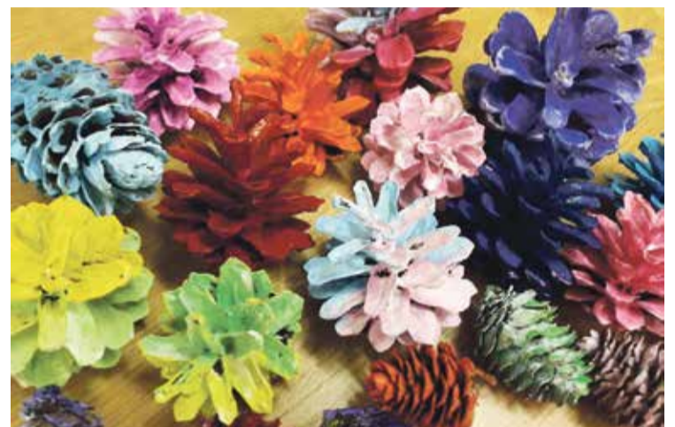
Krāsas var kombinēt, interesanti izskatās gradienta efekts (no tumšāka uz gaišāku un otrādi).