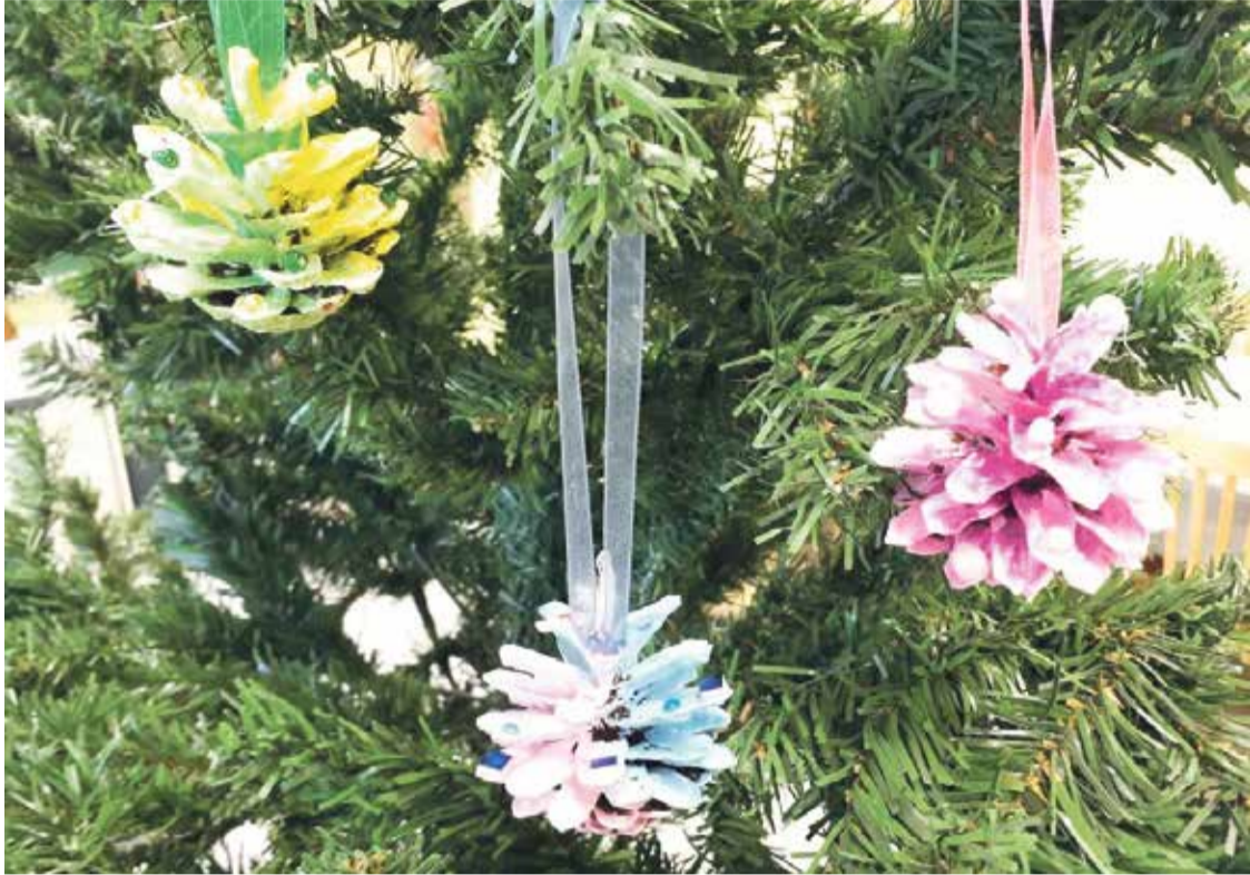
Ar krāsainiem čiekuriem rotāta eglīte.