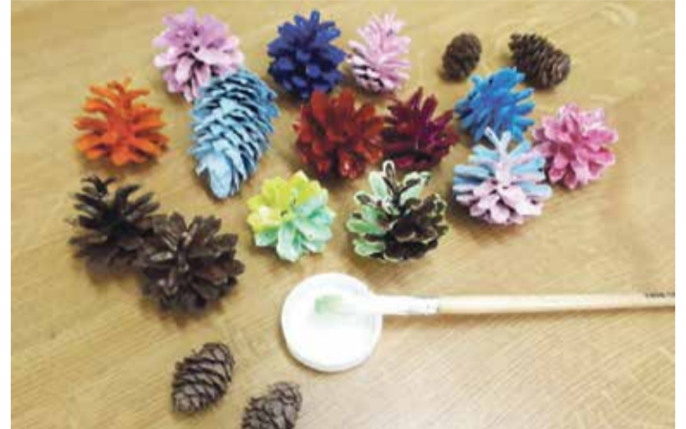
Atvērušos čiekurus ar guaša vai akrila krāsām nokrāso dažādos toņos.