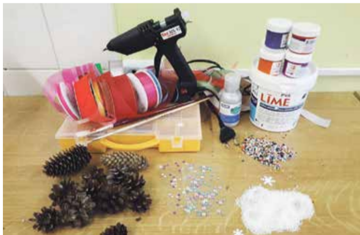
Darbam nepieciešamie materiāli.

Ziemassvētku tuvošanos iezīmē adventes laiks, kad tiek pīti eglu vai priežu zaru vainagi, kuros pakāpeniski iedez četras sveces. Mūsdienās, protams, tradicionālā adventes vainaga un sveču interpretācija var atšķirties, proti, ierasto eglu vai priežu zaru vietā tiek izmantotas, piemēram, dažādu augu drogas, eglītes rotājumi vai pat konfektes. Ziemassvētku priekšvakarā tīrīja un uzkopa māju, pēc tam to