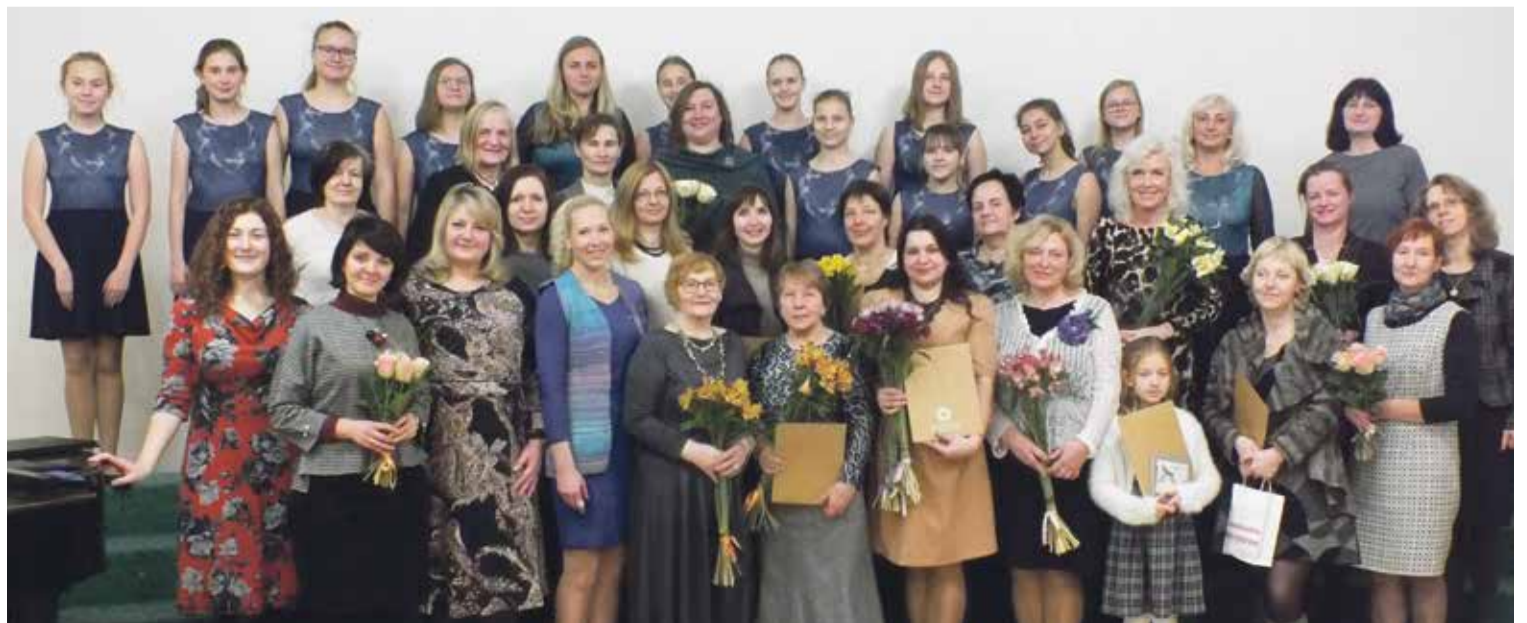
Visi skates dalībnieki, žūrija, BJC „Rīgas skolēnu pils” direktore kopā ar BJC „Rīgas skolēnu pils” meiteņu kamerkora „Tonika” audzēkņiem pēc apbalvošanas ceremonijas.