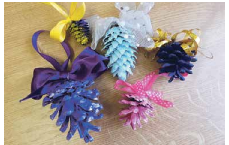
Pielīmējot lentītes un bantītes, izveidosim vēl greznākus čiekurus.

tās sāli. Pašus galiņus var nokrāsot ar sudraba krāsu. Lai izrotātu māju, nav vajadzīgi lieli finanšu ieguldījumi, vien jautri vakari – kopā ar bērniem