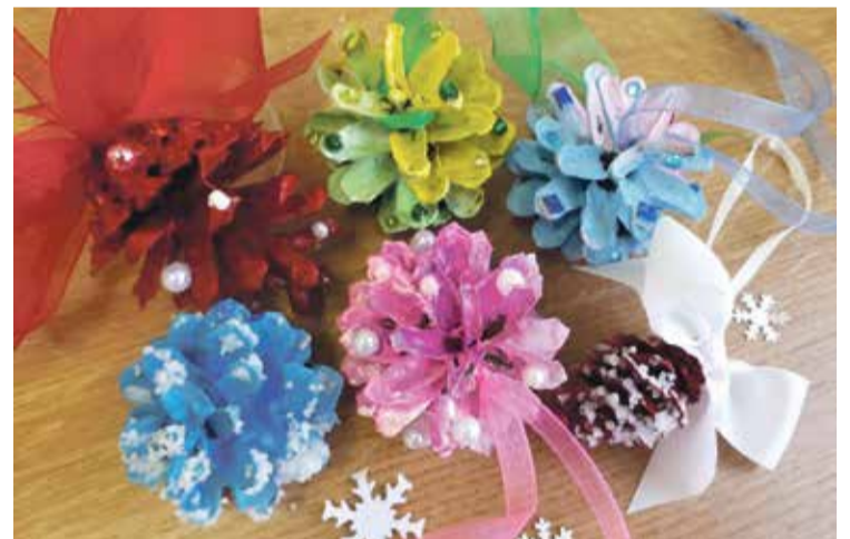
Katru čiekura zvīņu izrotā ar pielīmētu pērlīti, mirgojošu akmentiņu vai kādu citu dekoru.