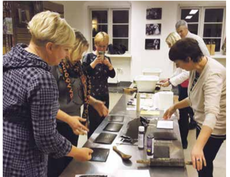
Radošā darbnīca Ventspils amatu mājā.